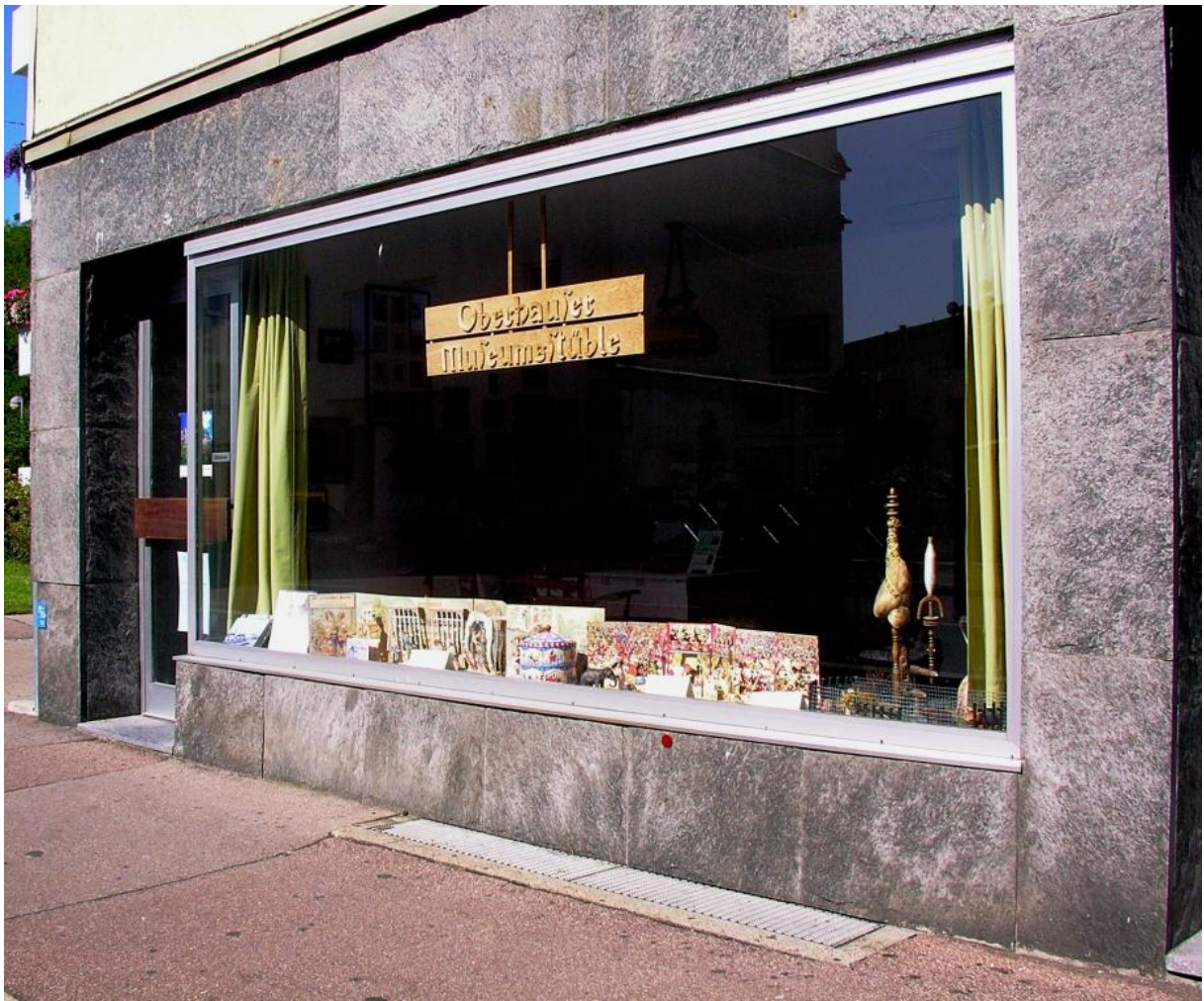
Zugang zum Museumsstüble in der Zollernstraße 91