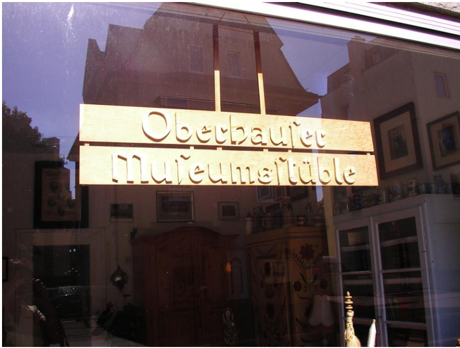
Das Schild im Schaufenster