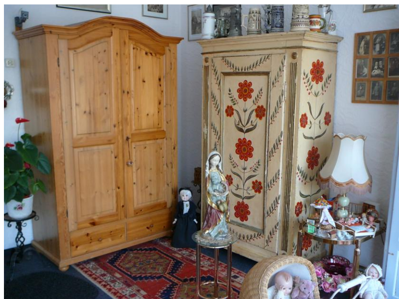
Blick in das Museumsstüble