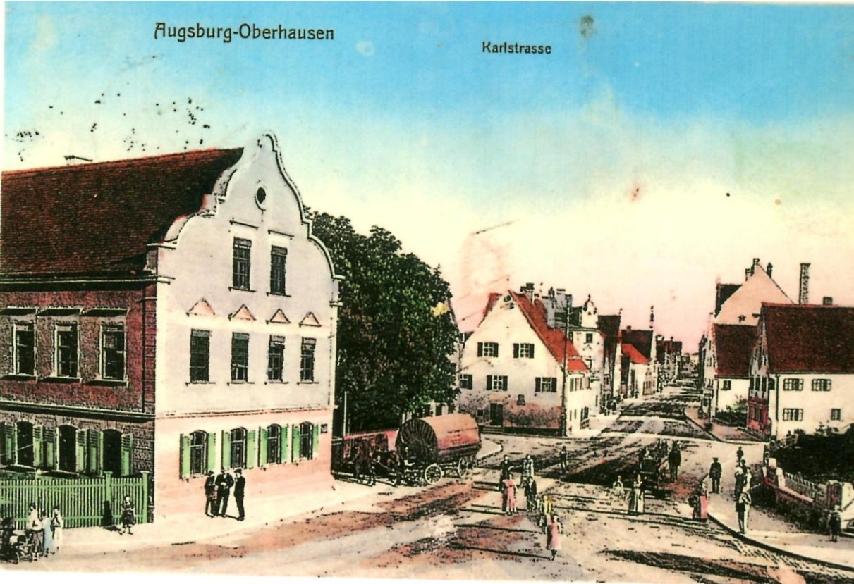
Das alte Oberhausen